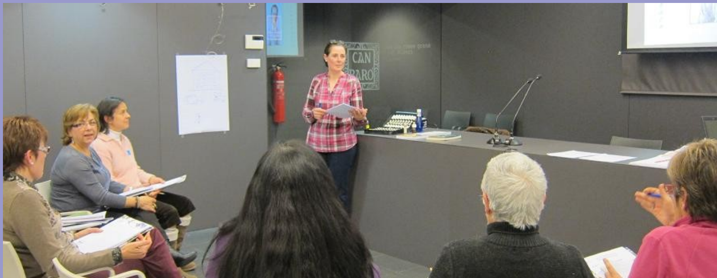
Imatge del curs organitzat de Flors de Bach (febrer 2013)